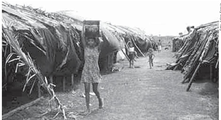
Acampamento Cabanos no Maranhão

A pesquisa identificou também duas correntes de pensamento entre juízes e promotores: uma que pode ser chamada de crítica, e outra auto-denominada “legalista”. Enquanto a primeira reconhece a imparcialidade desfavorável aos sem-terra e a incapacidade da justiça ao tratar a questão agrária, é a segunda a responsável por defender a aplicação da lei penal criminalizadora da luta pela reforma agrária. Em seus argumentos mais grosseiros e explícitos, afirmam a neutralidade política da justiça, criticam as concepções de direitos humanos (“Direitos só podem ser humanos... se é crime contra direitos humanos, é crime um simples furto, um simples homicídio, como um massacre”) e defendem um primário senso de igualdade desse juízo de tipicidade formal (“se a prisão é ruim, é ruim para o pobre e ruim para o rico... ou cadeia neste país só existe para rico?”). Já em seus argumentos mais sofisticados, atribuem ao tratamento criminal dos conflitos agrários uma função mediadora e restauradora do equilíbrio do conflito entre fazendeiros e trabalhadores sem-ter-